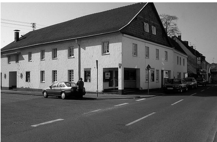
Bildquelle: Foto 130 Heinz Müller Stiftung