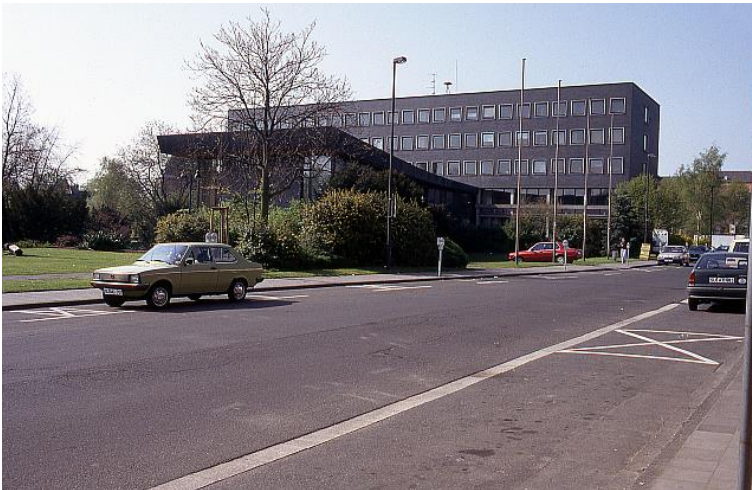
Bildquelle: Foto 180 Heinz Müller Stiftung

Hier gibt es eine Information für Bürger. Wie lautet die Hausnummer in der Adresse des hier Zuständigen?